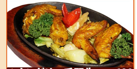
★タンドリー手羽先 4P ¥680