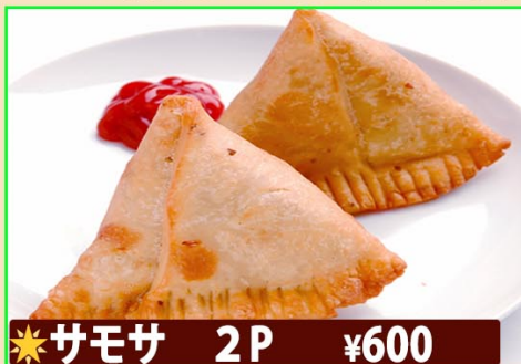
★サモサ 2P ¥600