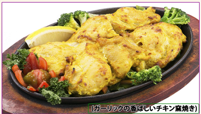
(ガーリックの香ばしいチキン窯焼き)