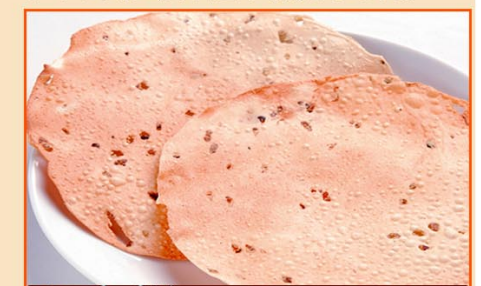
★パパド 2P ¥200