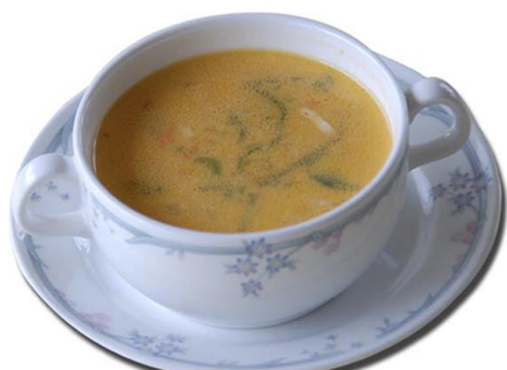
ベジタブルスープ ¥400