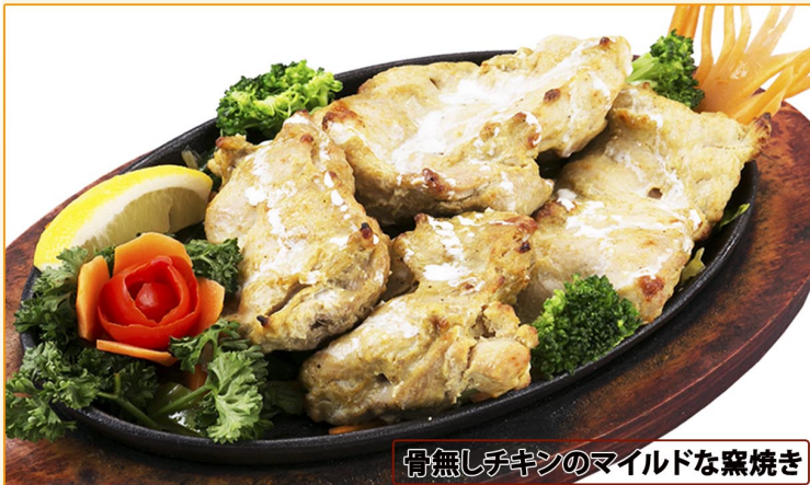
骨無しチキンのマイルドな窯焼き