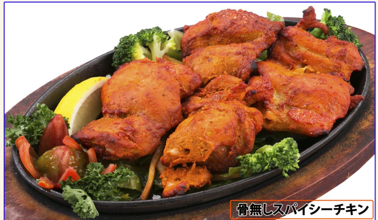
骨無しスパイシーチキン