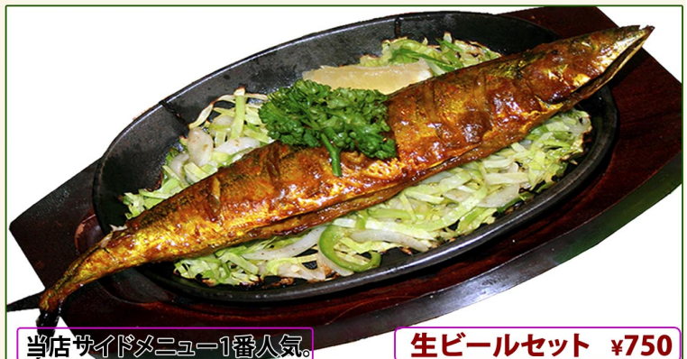
当店サイドメニュー1番人気