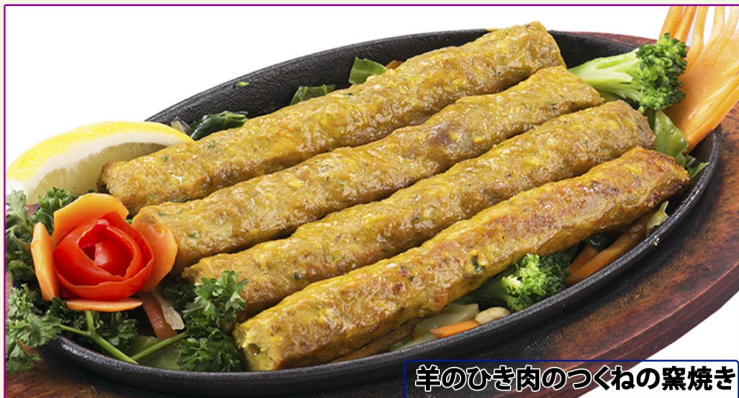
羊のひき肉のつくねの窯焼き