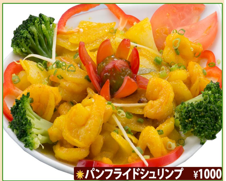
★パンフライドシュリンプ ¥1000