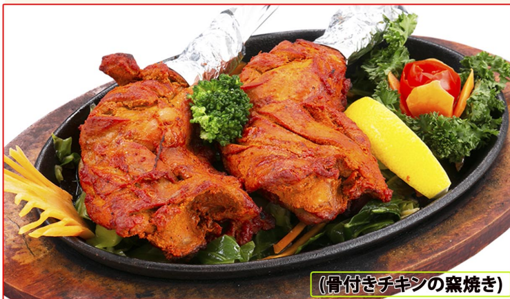
(骨付きチキンの窯焼き)