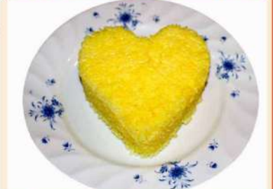
サフランライス 300円