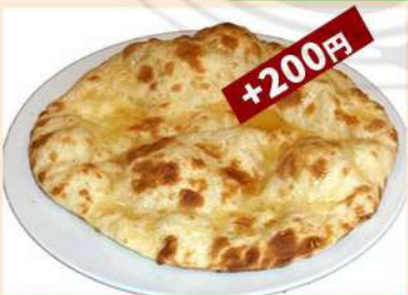
ガーリックナン 450円