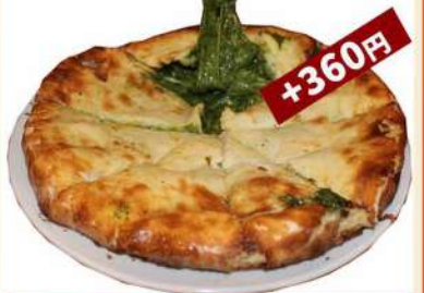
ガーリックチーズ 750円