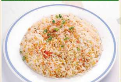
ビリヤニライス 680円