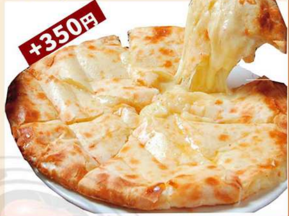
ピザ [pizza] ナン 750円